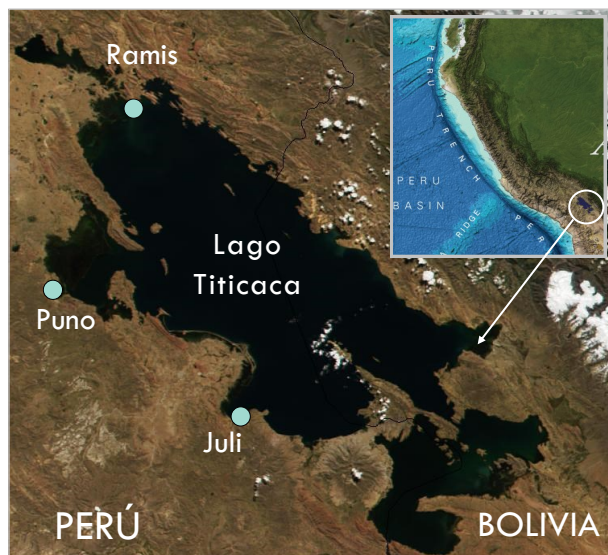
Figura 1. Localización de las estaciones limnológicas del IMARPE en el Lago Titicaca. Los mapas base y en el recuadro se adaptaron de NASA y de GEBCO (2014).

Este producto tiene el propósito de informar a la sociedad de las variaciones diarias de la temperatura superficial del agua en las estaciones limnológicas que administra el IMARPE en las localidades de Puno, Juli y Ramis.