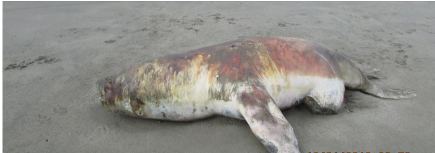
Ejemplar de lobo marino chusco encontrado en playa Puémape.

Por otro lado, al norte de Urricate, en la playa de Puémape se hallaron otras especies de cetáceos y pinnípedos varados, en avanzado estado de descomposición: dos marsopas espinosas ( Phocoena spinipinnis ), un macho adulto de 1.54 m y a una hembra juvenil de 0.96 m., dos delfines comunes de hocico largo ( Delphinus capensis ), un adulto (2.24 m) y un juvenil (1.92 m), de los cuales de no se logró determinar el sexo debido al grado de descomposición y un lobo chusco ( Otaria flavescens ) adulto.