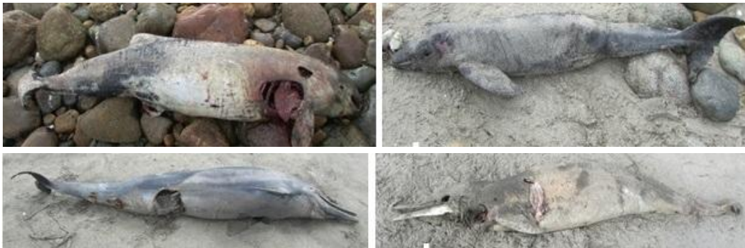
Marsopas y delfines comunes de hocico largo encontrados en playa Puémape.

Es importante agregar, que la zona de varamiento de la ballena azul guarda relación con la distribución de esta especie, principalmente ligada a la costa norte del Perú. Asimismo, el referido ámbito marino se constituye una zona de alimentación importante para el delfín común de hocico largo y la marsopa espinosa donde también se desarrollan actividades pesqueras.