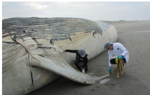
Ejemplar de ballena varada en estado de descomposición moderada, categoría 3, en playa Urricape, San Pedro de Lloc – La Libertad.

Los científicos, no lograron determinar las causas de su mortandad. Sin embargo, de acuerdo al análisis externo realizado al referido cetáceo, no se observaron signos evidentes de enredamiento en artes de pesca, ni lesiones expuestas. Tampoco se descarta que otros factores como colisión con alguna embarcación, enfermedades, ingesta de plásticos, podrían estar implicados en su deceso.