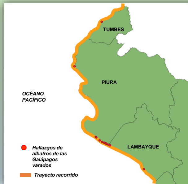
Fig 3.- Registros de Albatros de las Galápagos varados en la costa norte.

**En sus sitios de anidación se ha encontrado ingesta de plástico limitada.