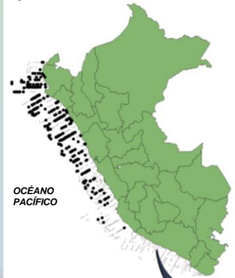
Fig 1.- Registros avistamientos de albatros de las Galápagos a bordo de cruceros.