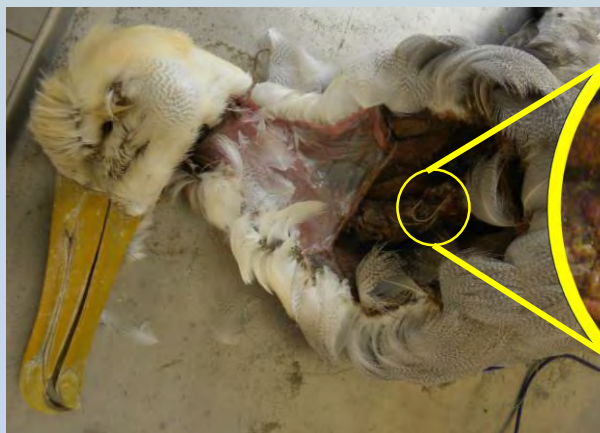
Fig 2.- Albatros de las Galápagos con anzuelo encontrado en el esófago.

**En sus sitios de anidación se ha encontrado ingesta de plástico limitada.