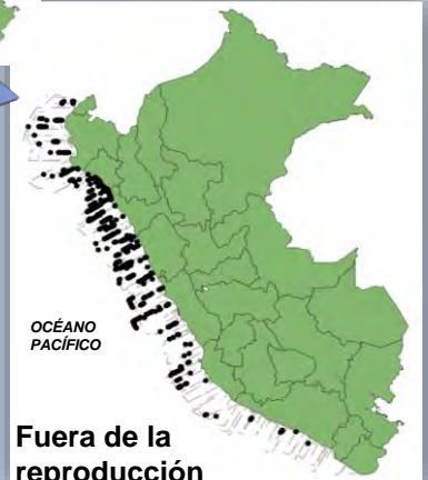
Fig 1.- Registros avistamientos de albatros de las Galápagos a bordo de cruceros.

En Perú, esta especie se ha podido observar a lo largo de toda la costa peruana. Sin embargo, durante su época de reproducción sólo se ha registrado hasta Lima (Imarpe 2022)