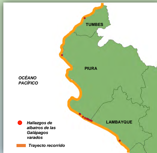
Fig 3.- Registros de Albatros de las Galápagos varados en la costa norte.