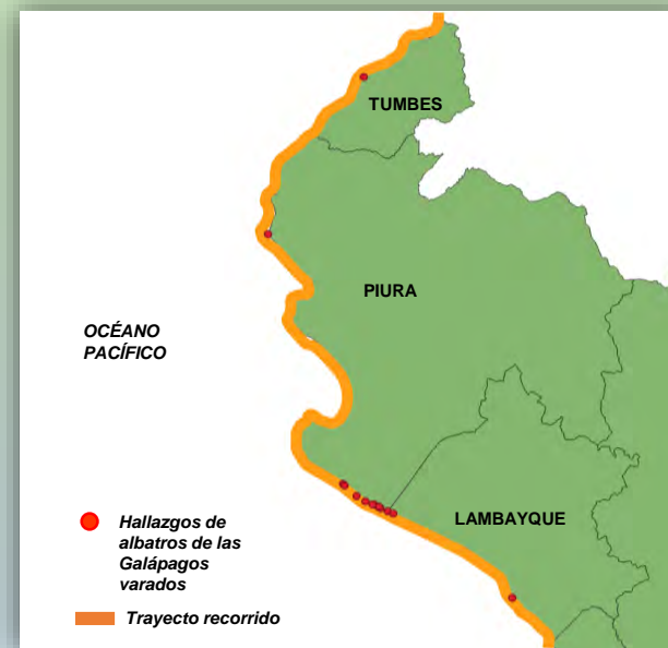
Fig 3.- Registros de Albatros de las Galápagos varados en la costa norte.

**En sus sitios de anidación se ha encontrado ingesta de plástico limitada.