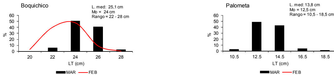
Fig. 3 Frecuencia de longitudes de las especies monitoreadas en los desembarques de Pucallpa

Aspectos reproductivos.- La Tabla 5, muestra los valores del Índice Gonado Somático (IGS) en hembras de boquichico, sardina y palometa que evidenciaron que estas especies han ingresado al periodo de inactividad reproductiva (0,25, 0,21 y 0,21% respectivamente).