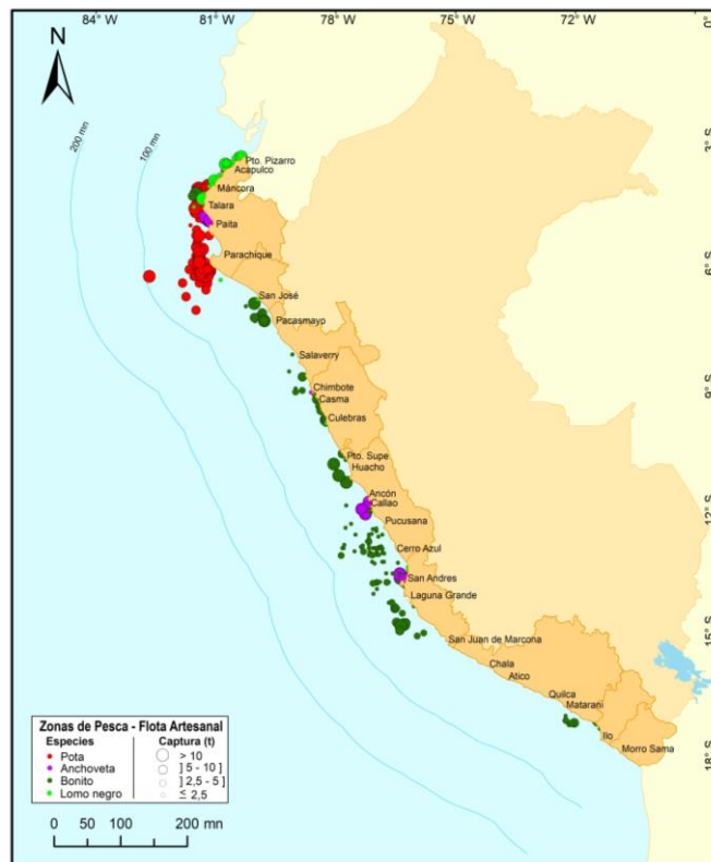
Figura 3.- Principales zonas de pesca de los recursos con mayores volúmenes de desembarque de la pesca artesanal.

Durante la semana, las principales zonas de pesca para pota se localizaron en el norte, entre los frentes de Isilla y Lobos de tierra, hasta 33 mn de distancia a la costa, además hubo importantes capturas entre los frentes de Máncora y Talara, dentro de 17 mn; para anchoveta , las zonas más productivas se ubicaron en el centro, frente a San Andrés, y Callao, hasta 11 mn, sin embargo, también se realizaron sustanciales capturas en el norte, frente a Paita, dentro de 5 mn; para bonito , las zonas más productivas se encontraron en el centro, entre los frentes de Laguna Grande e Infiernillo (Ica), hasta 36 mn, y frente a Chancay, Huacho, y Supe, entre 7-19 mn; finalmente para lomo negro , las zonas de pesca donde se realizaron las mayores capturas, estuvieron en el norte, frente a Pto. Pizarro, Zorritos, Cancas y Lobitos, entre 1-7 mn (Fig. 3).