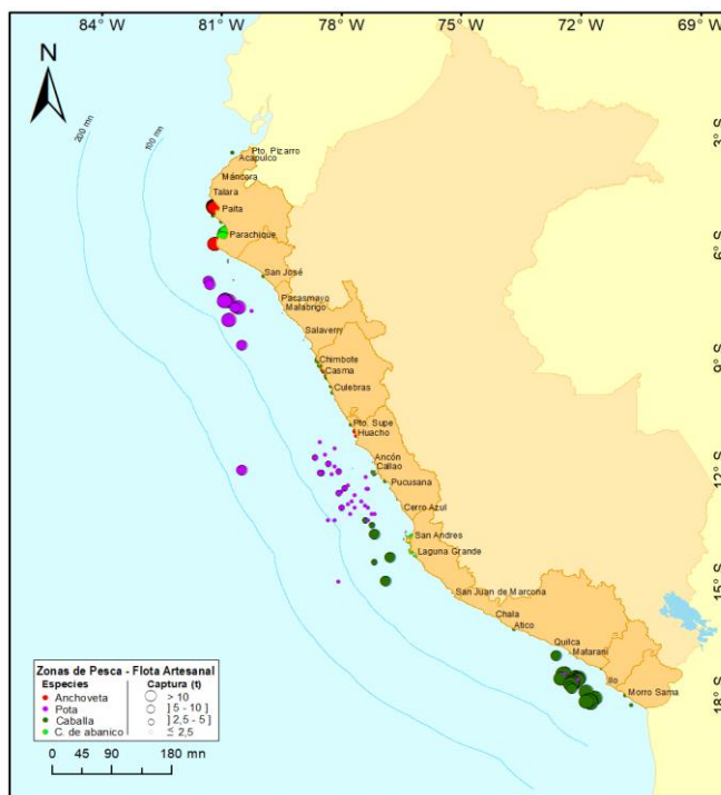
Figura 3.- Principales zonas de pesca de los recursos con mayores volúmenes de desembarque de la pesca artesanal

Condiciones ambientales: El área de observación comprende las zonas litorales adyacentes a los puntos de desembarque monitoreados.