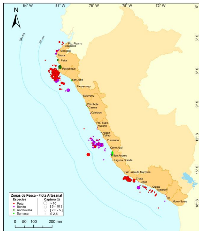
Figura 3.- Principales zonas de pesca de los recursos con mayores volúmenes de desembarque de la pesca artesanal.

Durante la semana, las principales zonas de pesca para pota se localizaron en el norte, entre los frentes de Parachique y Lobos de Tierra, dentro de 51 mn de distancia a la costa, además hubo importantes capturas en el sur, entre los frentes de Lomas y la bocana del Río Yauca (8-27 mn) y frente a Chala, entre 2-16 mn; para bonito , las zonas más productivas se ubicaron, en el centro, entre los frentes de Ancón y Pucusana, entre 22-74 mn, sin embargo también se realizaron capturas considerables en el norte, frente a Isla Lobos de Afuera (Lambayeque), entre 35-50 mn; para anchoveta , las zonas más importantes se encontraron en el norte, frente a Las Delicias, hasta 8 mn; finalmente para samasa , las zonas de pesca donde se realizaron las mayores capturas, estuvieron en el centro, entre los frentes de Tambo de Mora y San Andrés, dentro de 2 mn (Fig. 3).