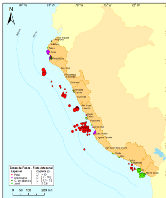
Figura 3.- Principales zonas de pesca de los recursos con mayores volúmenes de desembarque de la pesca artesanal

Durante la semana, las principales zonas de pesca para la gota se localizaron en la zona norte, desde Malabrigo hasta isla Lobos de Afuera, entre 85 y 100 mn de distancia a la costa, mientras que, en la zona centro, frente a Puerto Supe, entre 25 y 50 mn; para la anchoveta , las zonas de pesca más productivas se ubicaron en la zona norte, frente a Las Delicias y Paita, dentro de las 10 mn. Además, en la zona centro, frente a San Andrés, dentro de las 5 mn; para la concha de abanico , las zonas de pesca donde se realizaron las mayores capturas se ubicaron en la zona norte frente a Las Delicias y Parachique, dentro de las 05 mn; finalmente, para el jurel , las zonas de pesca donde se realizaron las mayores capturas se ubicaron en la zona sur, frente a Ilo (14 mn) e Ite (Tacna), entre 10 y 25 mn (Fig. 3).