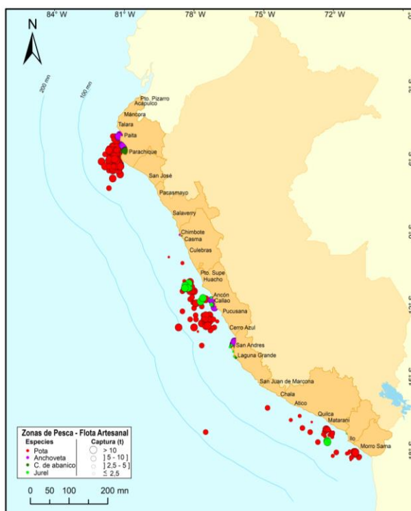
Figura 3.- Principales zonas de pesca de los recursos con mayores volúmenes de desembarque de la pesca artesanal

Durante la semana, las principales zonas de pesca para potá se localizaron en el norte, entre los frentes de Paita e Isla Lobos de tierra, entre 7-51 mn de distancia a la costa, además, también se realizaron importantes capturas en el centro, entre los frentes de Huacho a Cerro Azul (18-57 mn), y en el sur, entre los frentes de Matarani a Punta Bombón (14-33 mn) y frente a Morro Sama (11-37 mn); para Anchoveta , las zonas más productivas se ubicaron, en el centro, frente a San Andrés, Callao y Chorrillos, dentro de 5 mn, asimismo, se registraron capturas considerables en el norte, frente a Paita y Sechura, hasta 10 mn; para concha de abanico , las zonas más importantes se encontraron en el norte, frente a Parachique, dentro de 6 mn; finalmente para jurel , las zonas de pesca donde se realizaron las mayores capturas, se situaron en el centro, frente a Huacho, entre 27-50 mn, y Ancón, entre 19-34 mn (Fig. 3).