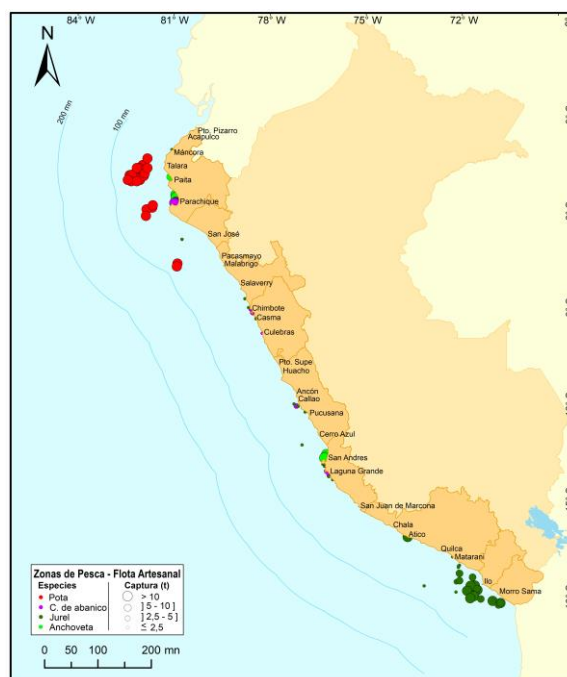
Figura 3.- Principales zonas de pesca de los recursos con mayores volúmenes de desembarque de la pesca artesanal

Condiciones ambientales: El área de observación comprende las zonas litorales adyacentes a los puntos de desembarque monitoreados.