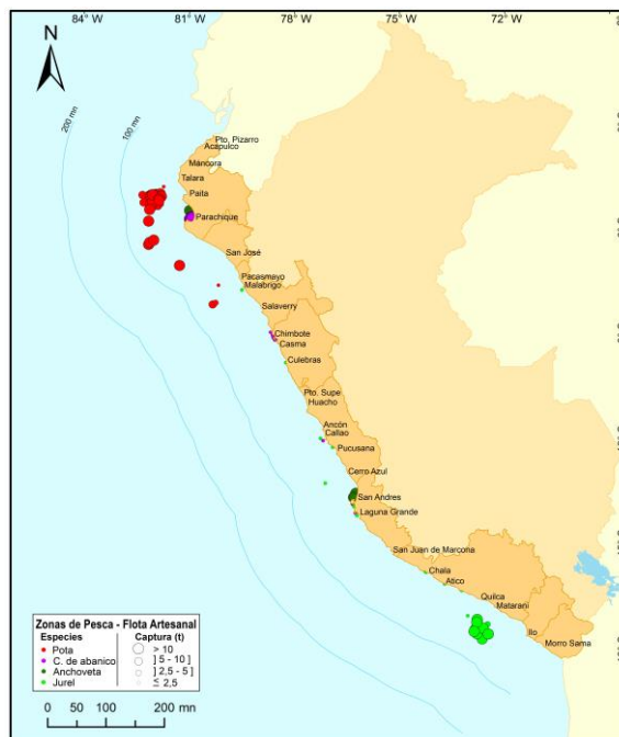
Figura 3.- Principales zonas de pesca de los recursos con mayores volúmenes de desembarque de la pesca artesanal

Durante la semana, las principales zonas de pesca para la potá se localizaron frente a la zona norte, desde Talara hasta Parachique, entre 40 y 65 mn de distancia a la costa. Asimismo, también se registraron importantes capturas frente a Punta Avid (Piura), entre 60 y 70 mn; para la concha de abanico , las zonas de pesca más productivas se encontraron en la zona norte, frente a Las Delicias y Parachique, dentro de las 4 mn de distancia a la costa; para la anchoveta , las zonas de pesca donde se realizaron las mayores capturas se ubicaron en la zona centro, desde Pisco a San Andrés, dentro de las 5 mn, mientras que, en la zona norte, frente a Chulliyachi, dentro de las 6 mn; finalmente, para el jurel , sus zonas de pesca más importantes se situaron frente a la zona sur, desde Quilca hasta Punta Bombon (Arequipa), entre 30 y 55 mn (Fig. 3).