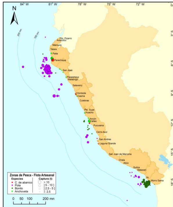
Figura 3.- Principales zonas de pesca de los recursos con mayores volúmenes de desembarque de la pesca artesanal