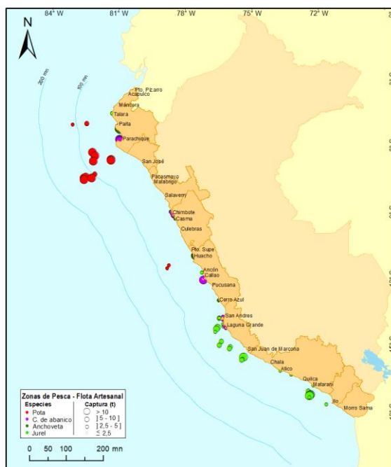
Figura 3.- Principales zonas de pesca de los recursos con mayores volúmenes de desembarque de la pesca artesanal

Condiciones ambientales: El área de observación comprende las zonas litorales adyacentes a los puntos de desembarque monitoreados.