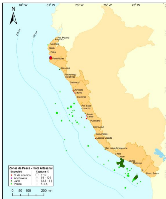
Figura 3.- Principales zonas de pesca de los recursos con mayores volúmenes de desembarque de la pesca artesanal