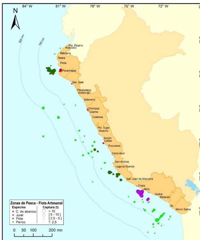
Figura 3.- Principales zonas de pesca de los recursos con mayores volúmenes de desembarque de la pesca artesanal

Condiciones ambientales: El área de observación comprende las zonas litorales adyacentes a los puntos de desembarque monitoreados.