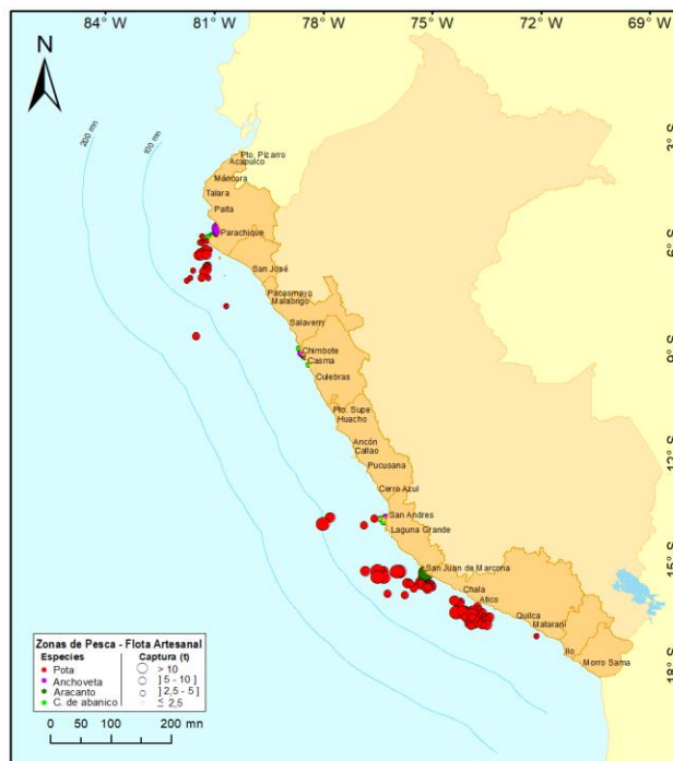
Figura 3.- Principales zonas de pesca de los recursos con mayores volúmenes de desembarque de la pesca artesanal

Durante la presente semana, las zonas de pesca de potá que registraron concentraciones importantes, se ubicaron frente a la sección geográfica comprendida entre la Reserva Nacional Illescas y la Isla Lobos de Tierra, de 7 a 68 mn de distancia a la costa, en la zona norte. Destacaron, asimismo, las zonas de pesca registradas frente a la región Ica, de 13 a 60 mn; y, frente a Arequipa, desde Chala hasta Ático, entre 32 y 60 mn, en la zona sur. Para la anchoveta , las zonas de pesca con mayores capturas se registraron frente a Paita y Las Delicias, dentro de las 6 mn. Para el recurso aracanto , las zonas de recolección se ubicaron básicamente en la franja costera del litoral de San Juan de Marcona, dentro de la primera milla náutica. Finalmente, para la concha de abanico , las zonas de mayor extracción se registraron frente a Las Delicias y Parachique, dentro de las 5 mn, en la zona norte (Fig. 3).