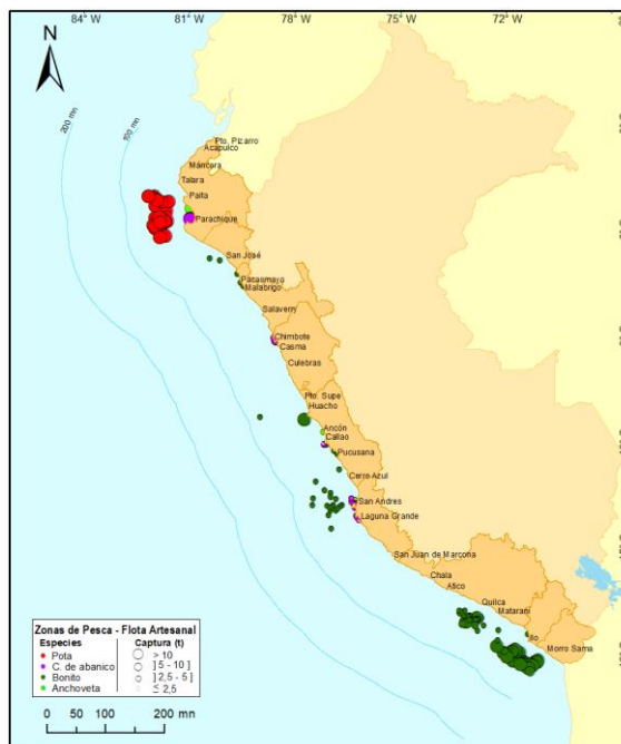
Figura 3.- Principales zonas de pesca de los recursos con mayores volúmenes de desembarque de la pesca artesanal

Condiciones ambientales: El área de observación comprende las zonas litorales adyacentes a los puntos de desembarque monitoreados.