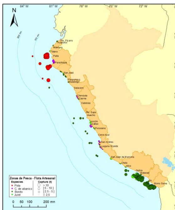
Figura 3.- Principales zonas de pesca de los recursos con mayores volúmenes de desembarque de la pesca artesanal

Condiciones ambientales: El área de observación comprende las zonas litorales adyacentes a los puntos de desembarque monitoreados.